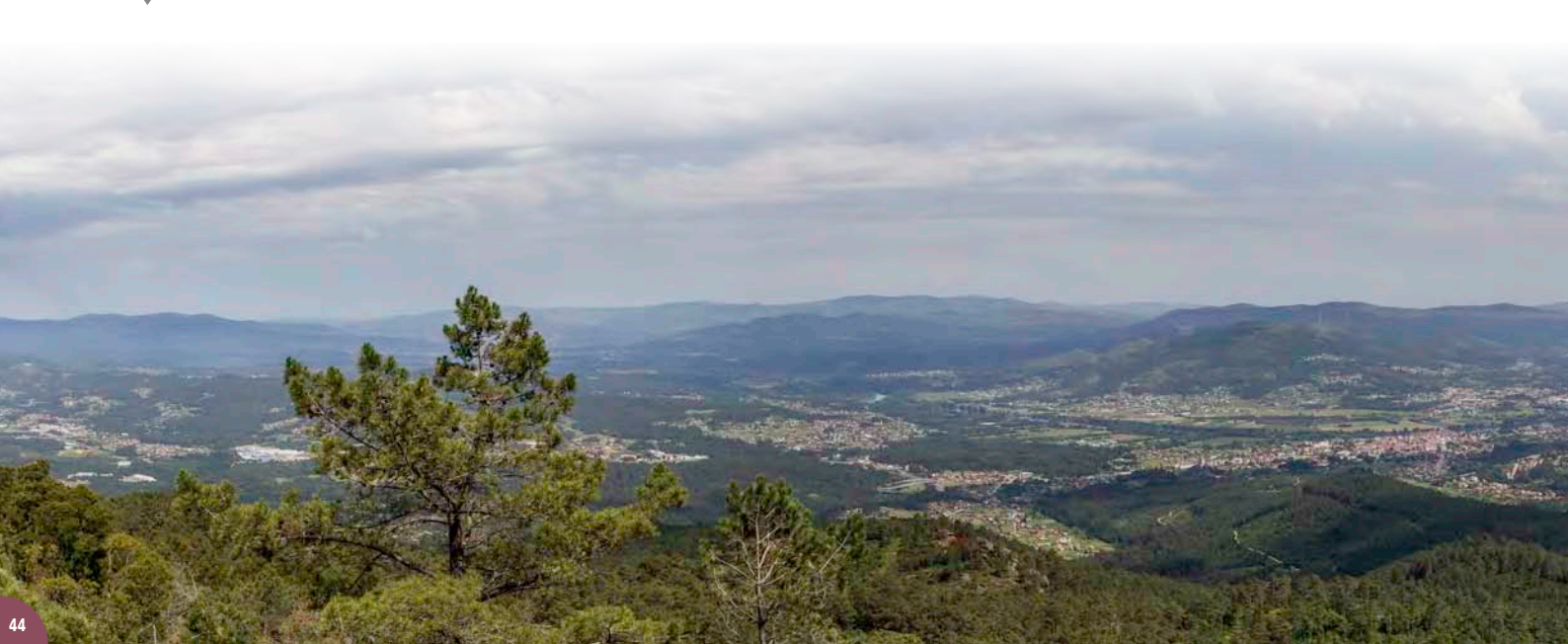
▼ Panorámica desde o alto da Cruz de San Xiao

Somos serra, a serra protéxenos, e nós protexerémola.