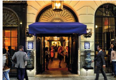
Only You Hotels Personalized Signature Hotels