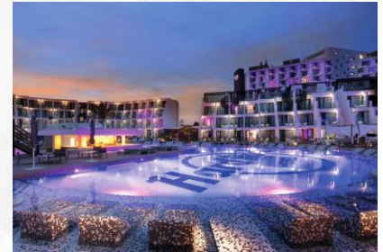
Hard Rock Hotels Musically-Infused Hotels for all ages