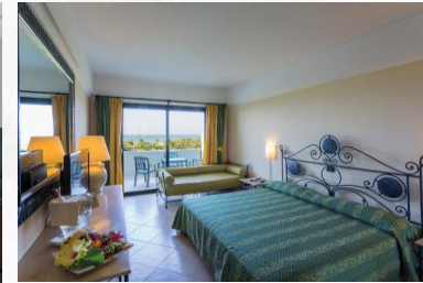
Fiesta Hotels & Resorts Three-Star Hotels in beautiful natural settings