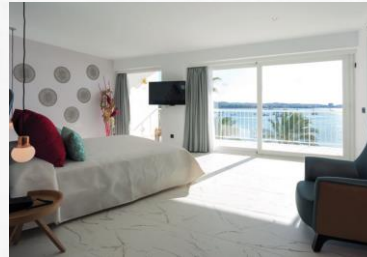
Palladium Hotels Vacational Four-Star Hotels