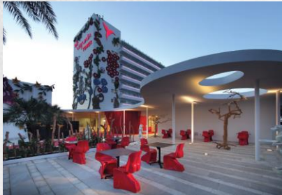
Ushuaïa Ibiza Beach Hotel Exclusive Adults-Only Luxury Hotel & Club