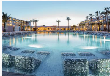
Grand Palladium Hotel & Resorts Vacational Five-Star Hotels & Resorts