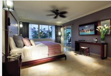
The Royal Suites by Palladium Adults-only Luxury Accomodation