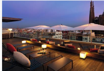
Ayre Hoteles Modern Urban Hotels