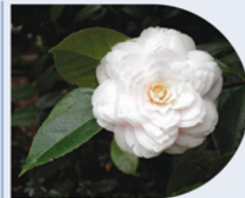
C. japonica "Incarnata"