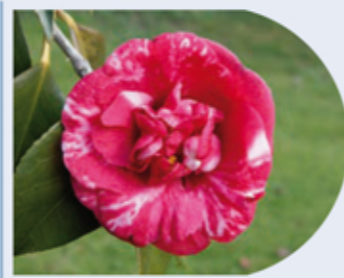
C. japonica "Kellingtonia"