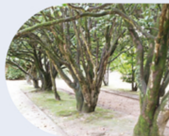
Paseo de camelias Paseo de camelias Camellia walk