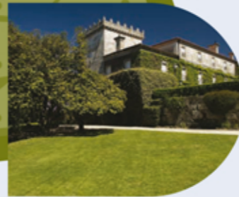
Vista do pazo Vista del Pazo View of the Villa