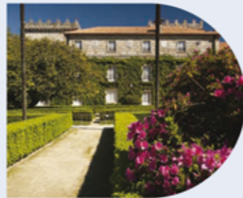
Vista do pazo Vista del Pazo View of the Villa