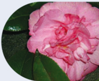
C. japonica coñecida como "Matusalén" C. japonica conocida como "Matusalén" C. japonica known as "Matusalén"