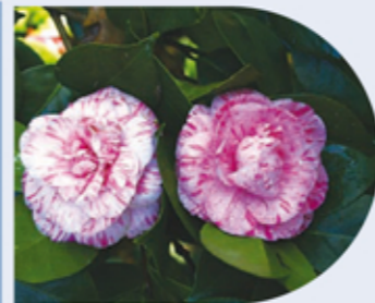
C. japonica "Bella Romana"