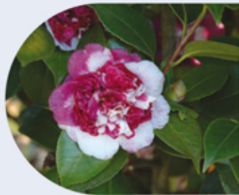
C. japonica "Herzilia II"