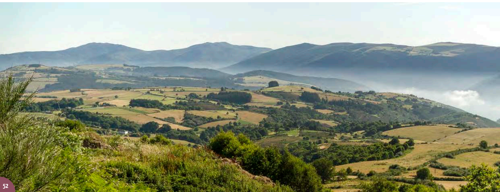
▼ Néboas no val do Navia.

actuais albergues. O tránsito cara a Fonfría permite a contemplación ao lonxe das Terras de Oscos e de grande parte do extenso concello fonsagradino (o de maior superficie de Galicia con 400 km 2 ). O desvío cara a Liñares de Bidul introduce o percorrido en paisaxes de piñeirais e matogueiras representativos destas serras e de rechamantes coloridos estacionais. Cara a Vilar de Cuíña, a forte pendente permite as primeiras perspectivas sobre o encaixado val do río Navia. O percorrido prosegue seguindo o curso do río, acompañándoo dende o alto, pasando pola Fornaza e por Arexo co seu imponente miradoiro. A estrada vai baixando cara ao río Navia, coas súas augas embalsadas polo encoro de Salime, na procura de Ponte de Boabdil, único paso cara a Asturias en moitos quilómetros de río. O accidentado terreo de ladeira permite o paso por dous miradoiros habilitados, bos espazos para o lecer e a contemplación, moi preto xa de