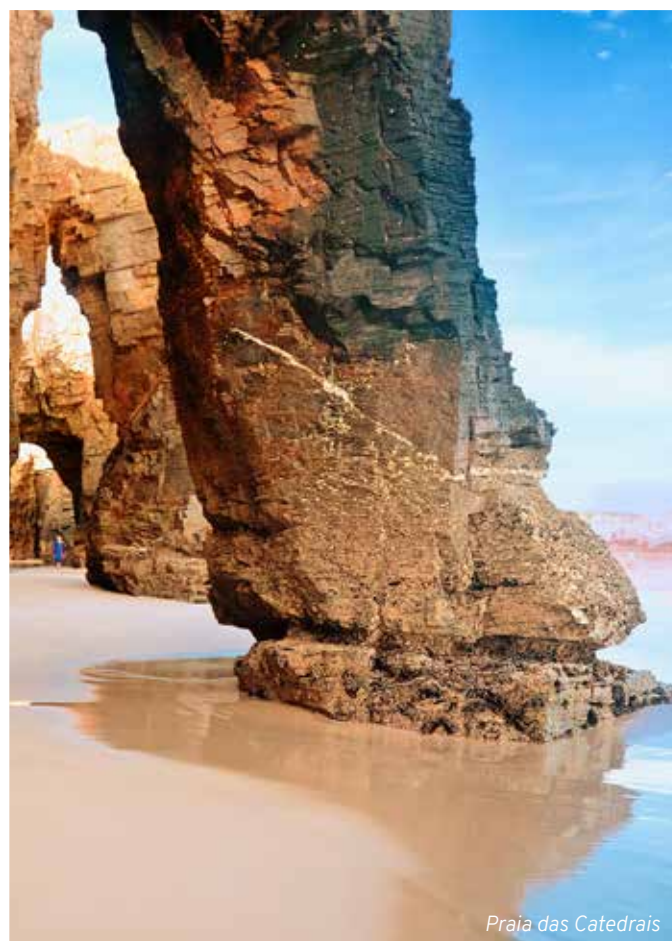
Praia das Catedrais