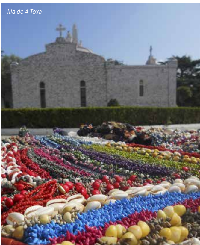
Illas de A Toxa

Pola tarde faremos un tramo da "Ruta da Pedra e da Auga". A ruta transcorre á beira do río Armenteira polos municipios de Ribadumia e Meis, no corazón do Salnés, unha bela e turística comarca próxima á ría de Arousa, con magníficas praias na franxa litoral e fermosas estampas vitivinícolas no interior. O sendeiro coincide cun vello camiño que a poboación local percorría cada luns de Pascua para subir ata o mosteiro da Armenteira, que visitaremos. Regreso ao hotel. Cea e aloxamento.