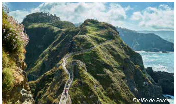
Fuciño do Porco