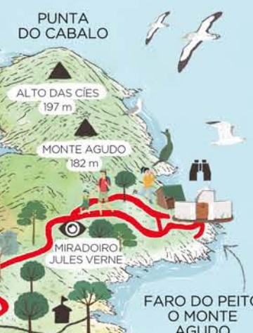
ISLA NORTE O DE MONTEAGUDO

Un balcón de roca donde contemplar el lago y los acantilados. En el verano las crías de gaviota tienen aquí su guardería por lo que para no molestarlas, no entres en la zona de reserva indicada ni las alimentos.