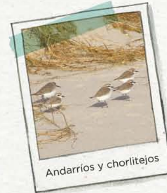
Andarrios y chorlitejos

LAS PLAYAS se encuentran en la costa más tranquila, donde el mar deposita las arenas. Estas arenas son retenidas por las plantas de la duna, evitando así la erosión de la playa.