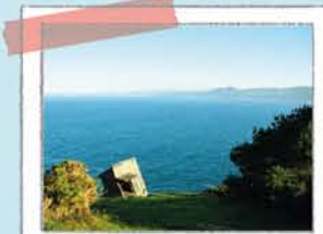
OBSERVATORIO DE O PEITO

Un remanso en el océano, es un refugio para la vida marina. Paseando por su dique podrás ver distintos peces. Para no alterar sus costumbres no debes alimentarlos ni bañarte en el lago.