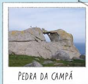
PEDRA DA CAMPÁ

Situado en el punto más alto visitable. Buen sitio donde contemplar el acantilado y el vuelo de las gaviotas que allí crían. Para no alterarlas no te acerques ni alimentos a las aves.