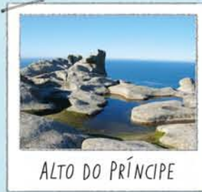
ALTO DO PRÍNCIPE

Una roca horadada por el viento y la sal del ambiente. Subirse está prohibido por molestias a las aves. Desde el observatorio próximo se disfruta de bonitas vistas del lago y los acantilados.