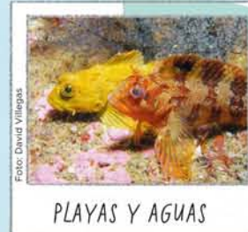
PLAYAS Y AGUAS

Antiguo monasterio de San Estevo. En su exposición interior podrás descubrir la naturaleza y la historia de las islas. Consultar horarios.