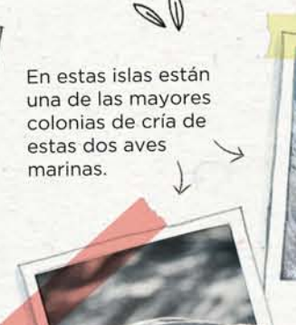
Pollo de cormorán moñudo

En estas islas están una de las mayores colonias de cría de estas dos aves marinas.