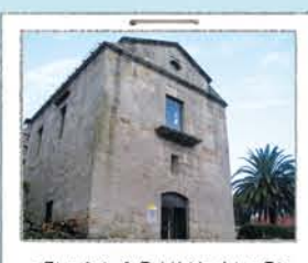
CENTRO DE VISITANTES

Enfrentado a la isla Sur, de la que nos regala una de sus mejores panorámicas.