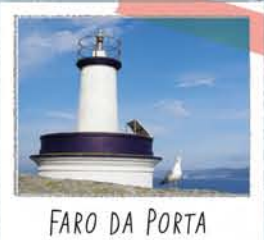
FARO DA PORTA

Enfrentado a la isla Sur, de la que nos regala una de sus mejores panorámicas.