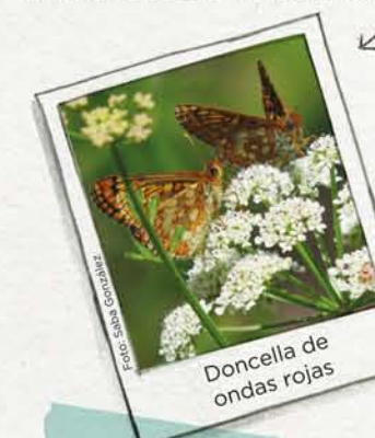
Doncella de ondas rojas

Euphydryas aurinia . Es una mariposa protegida en Europa pues está desapareciendo en muchos sitios.